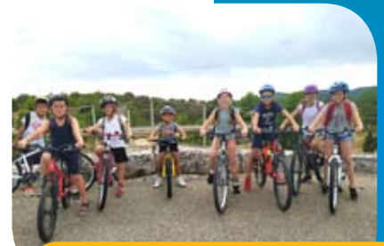
↳ Conseil des jeunes P7