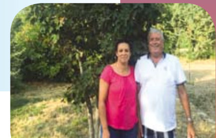
↳ Une histoire P20