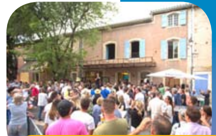
↳ Un nouveau café P11