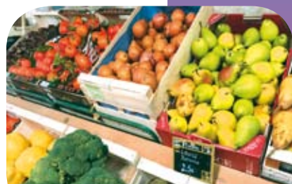
Fruits et légumes P13

AVIS AUX ASSOCIATIONS Vous souhaitez publier un article dans le prochain bulletin municipal ? Merci de déposer vos documents signés à la Médiathèque Municipale