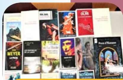
La médiathèque P24