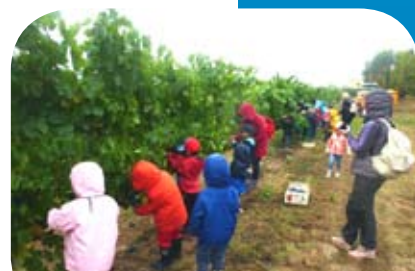
Les écoliers P12