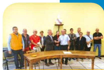
↳ Charte commerces P9