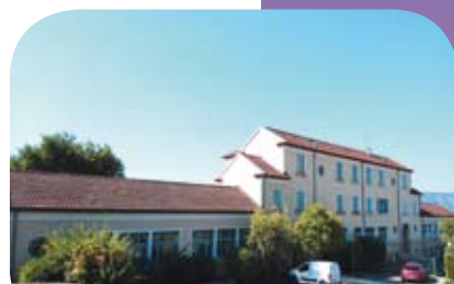
↳ Aux écoles P14

AVIS AUX ASSOCIATIONS Vous souhaitez publier un article dans le prochain bulletin municipal ? Merci de déposer vos documents signés à la MAISON DE VILLAGE