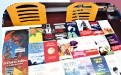
↳ Médiathèque P20