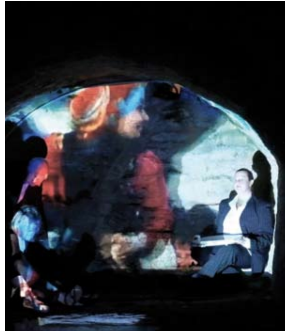
Article et photo : théâtre Chelsea Hotel

Prenant comme colonne vertébrale de cette recherche l'histoire de la lanceuse d'alerte Bradley/Chelsea Manning, la Compagnie partage impressions, évocations, vécus personnels, questionnements. Aucune réponse ou assignation... une réflexion collective entre ces artistes d'horizons multiples et le public. ■