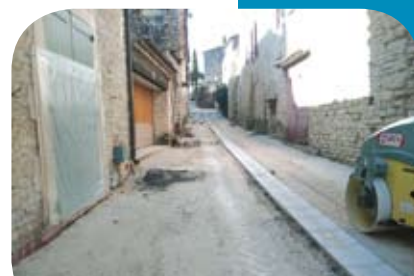
↳ Aménagements P8